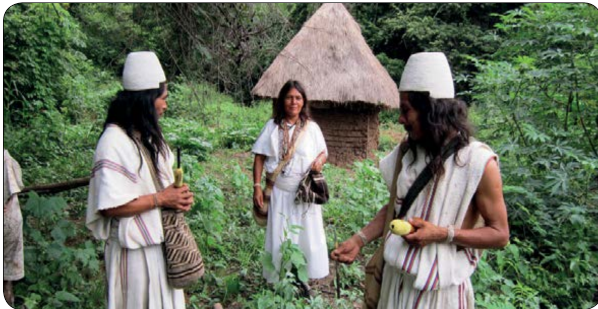
Foto: seguridad alimentaria y reforestación ambiental pueblo comunidad Arhuaco

Ahora bien, teniendo en cuenta la necesidad de articular los diferentes actores del sector, el Ministerio ha venido trabajando en conjunto con la Agencia Nacional de Minería-ANM-,