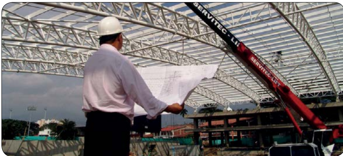
Foto: construcción de estadio olímpico Valle del Cauca

El Gobierno Nacional trabajó en la creación del Sistema General de Regalías (SGR), el cual se produjo mediante el Acto Legislativo No. 05 de 2011. En éste se modificaron los artículos 360 y 361 de la Constitución Política, además de dictar disposiciones sobre el régimen de regalías y compensaciones.