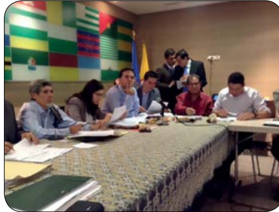
Foto: Sesión de OCAD departamental del Meta

Por decisión del Consejo de Ministros del 27 de mayo de 2013, el Ministerio de Minas y Energía ha sido designado para participar en