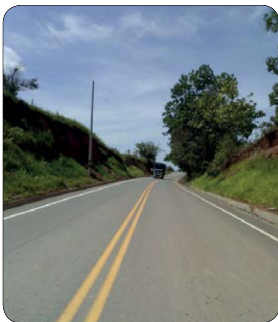
Foto: Circuitos viales en Antioquia

la Comisión Rectora del Sistema General de Regalías es el órgano encargado de definir la política general del Sistema General de Regalías.