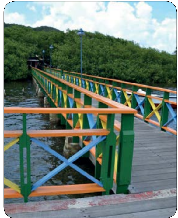
Foto: restauración obra el fuerte en San Andrés y Provicencia

tos espacios se ha brindado apoyo a las entidades territoriales en la mejora para la estructuración de proyectos de inversión haciendo énfasis en aquellos que se relacionen con el sector minero energético.