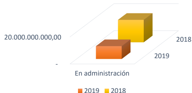
RECURSOS RECIBIDOS EN ADMINISTRACION

Para el año 2018 la cuenta de otros pasivos correspondiente a recursos recibidos en administración con corte a abril presenta un valor de $16.605.434.295,44 y con el mismo corte a 2019 con un valor de $9.479.572.353,24 con una variación absoluta de -$7.125.861.942,20 la cual corresponde a utilización de recursos del contrato de fiducia mercantil suscrito entre el Ministerio de Minas y Energía y la Fiduciaria de Occidente para la administración y manejo por parte de la fiduciaria de los recursos asignados a la Comisión de Regulación de Energía y Gas - CREG.