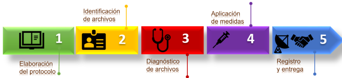
Figura 1. Mapa de ruta para la implementación del Protocolo de Archivos de DH, MH y CA en el Ministerio

A continuación (Figura 1), se presenta de manera esquemática las acciones que se deben realizar en el Ministerio para la implementación del Protocolo de gestión documental de los archivos de derechos humanos, memoria histórica y conflicto armado: