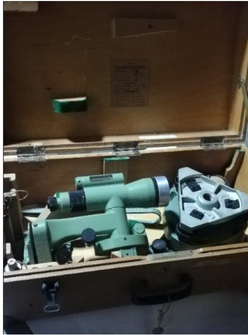
204019 – TEODOLITO AUTOREGULADOR