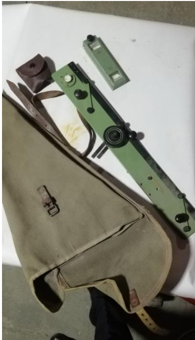
204018 – TELEMETRO TENA