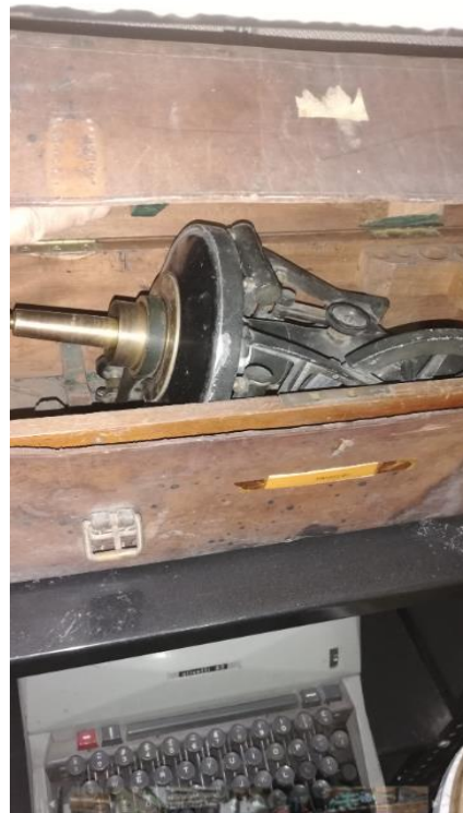
204020 - TRANSITO

En Minenergía todos los trámites son gratuitos.