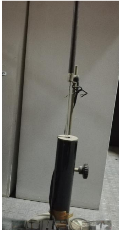
204009 - CALORIMETRO PEAN