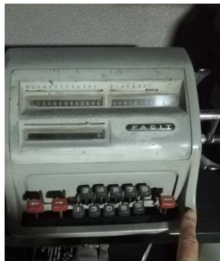
204008 - CALCULADORA FACIT

En Minenergía todos los trámites son gratuitos.