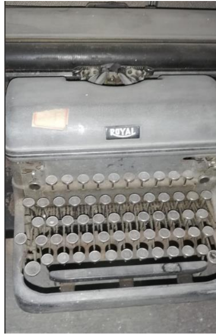
20 40 12 - ESPECTOMETRO CON ESCALA 204014 - MAQUINA DE ESCRIBIR ROYAL