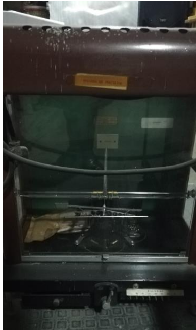
204002 - BALANZA DE PRECISION