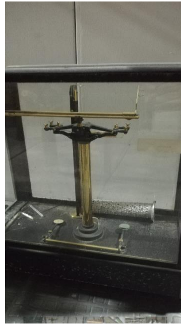
204006 - BALANZA AINSWORTH