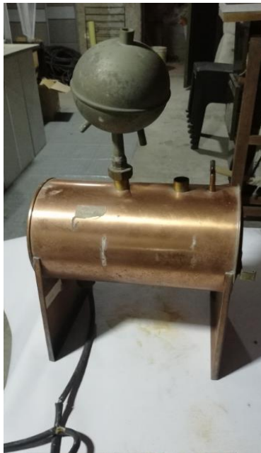
PLACA 204007 - BOEKEL HORNO