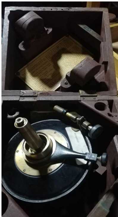
204021 – TRANSITO