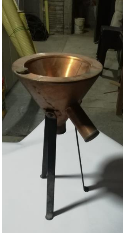
204011 - EMBUDO DE COBRE