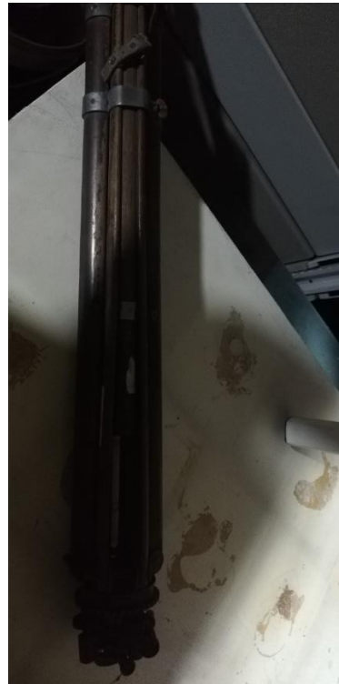
204022 – TRIPODE

La presente certificación se expide en la ciudad de Bogotá, D.C., el 28 de abril de 2023.