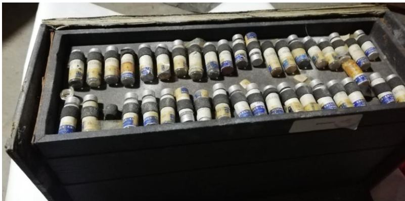
204010 - COLECCIÓN DE MUESTRAS MINEROLOGICAS

En Minenergía todos los trámites son gratuitos.