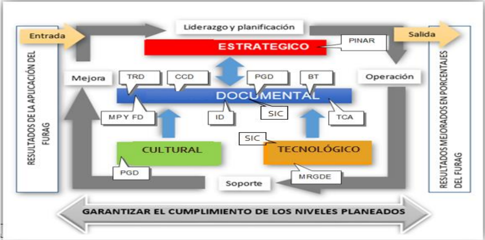
Ilustración 2 Modelo conceptual - Instrumentos archivísticos.

Por lo anterior, jerarquizar los instrumentos archivísticos permite determinar su importancia frente al uso y su finalidad, apoyando las líneas estratégicas y los principios de planeación, eficiencia, economía, control y seguimiento, oportunidad, transparencia, y protección al medio ambiente apoyando las líneas estratégicas para la gestión documental y administración de archivos.