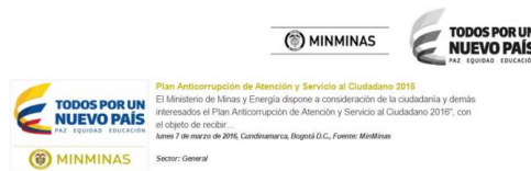
Ilustración 2 Divulgación en el Módulo de Noticias del Portal Web