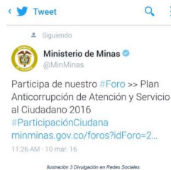
Ilustración 3 Divulgación en Redes Sociales