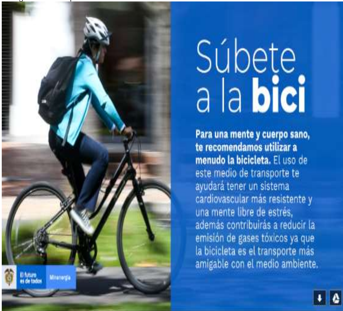
Imagen 3. Campaña súbete a la bici