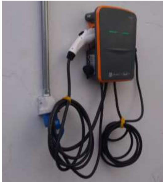
Imagen 5. Instalación de cargador eléctrico

Según la información anterior El Ministerio de Minas y Energía ha promovido las campañas “Usar mi bicicleta diariamente me reconforta”, “súbete a la bici” “Huella de Carbono del Minenergía”, e “instalación de cargador para vehículos eléctricos” con lo cual ha fomentado el uso de medios de transporte ambientalmente sostenibles.