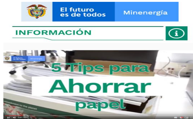
Imagen 2. Campaña inicio de actividades de educación ambiental