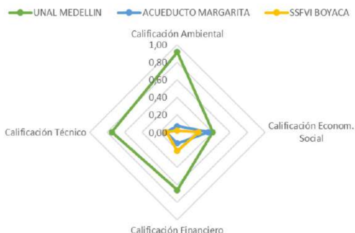
Grafica 1. Puntuación para cada dimensión evaluada para proyectos de FNCE.

Indica la Dirección Ejecutiva del FENOGGE, de conformidad con la presentación compartida con los miembros del Comité Directivo que, en la gráfica relacionada se puede verificar la puntuación presentada por cada uno de los criterios.