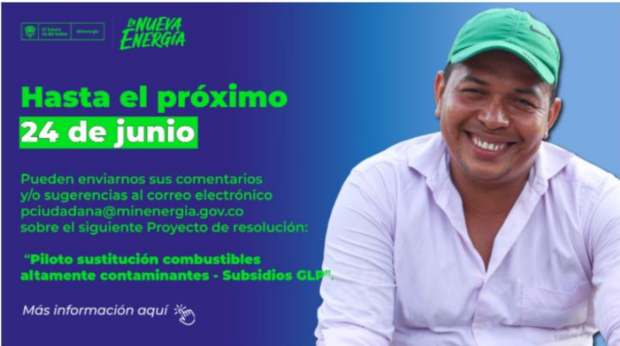
Ilustración 2 Divulgación: mediante boletín ciudadano enviado a correos electrónicos de los ciudadanos y grupos de valor del MinEnergía