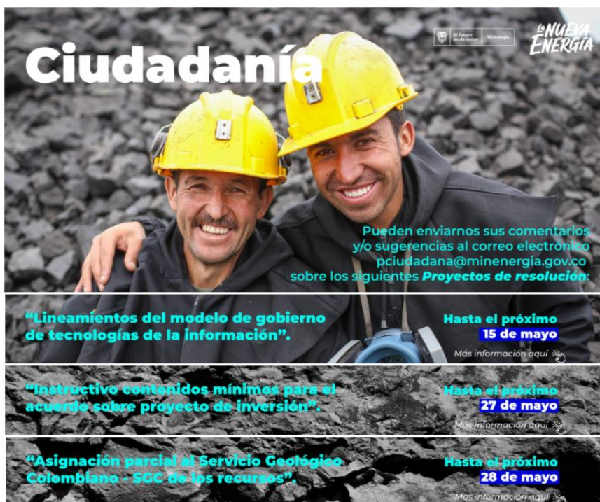
Ilustración 3 Divulgación: mensaje correo electrónico de ciudadanos y grupos de valor