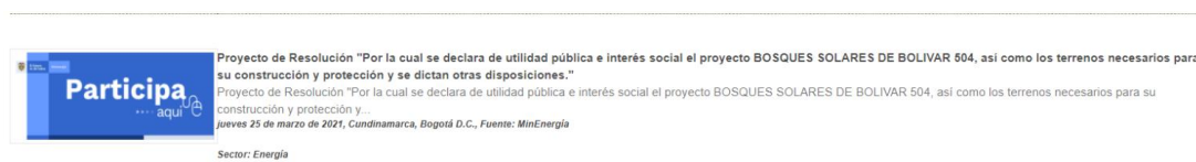
Ilustración 2

En Minenergía todos los trámites son gratuitos.