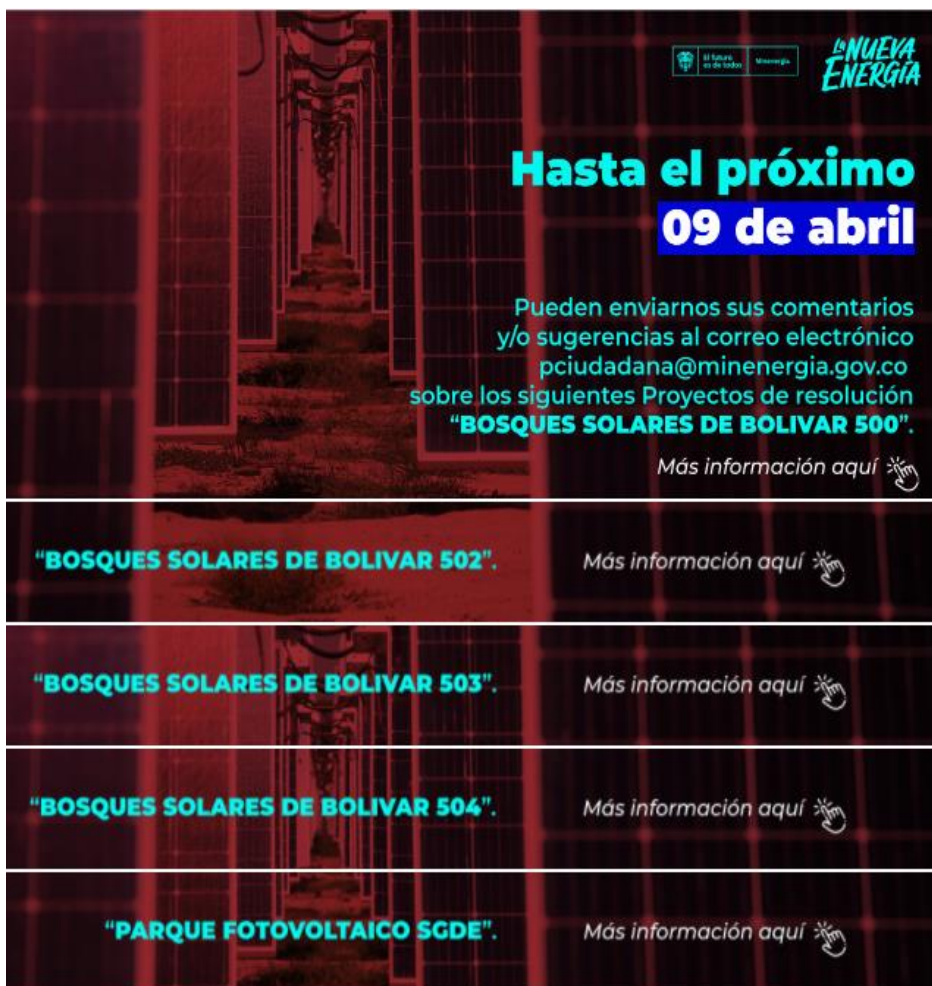
Ilustración 3 Divulgación: Boletín Ciudadano