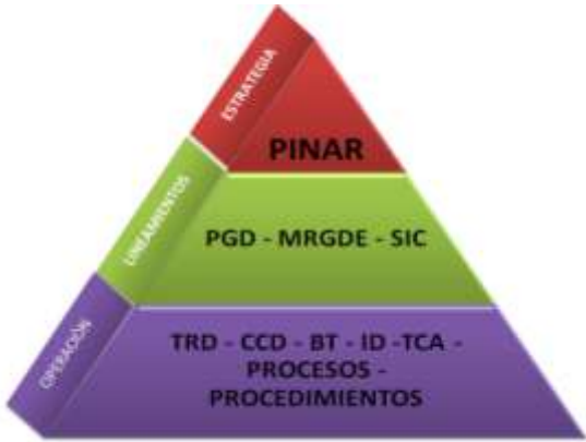
Ilustración 3 Niveles Jerárquicos - Instrumentos Archivísticos.