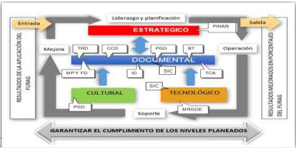
Ilustración 2 Modelo conceptual - Instrumentos archivísticos.

Por lo anterior, jerarquizar los instrumentos archivísticos permite determinar su importancia frente al uso y su finalidad, apoyando las líneas estratégicas y los principios de planeación, eficiencia, economía, control y seguimiento, oportunidad, transparencia, y protección al medio ambiente apoyando las líneas estratégicas para la gestión documental y administración de archivos.