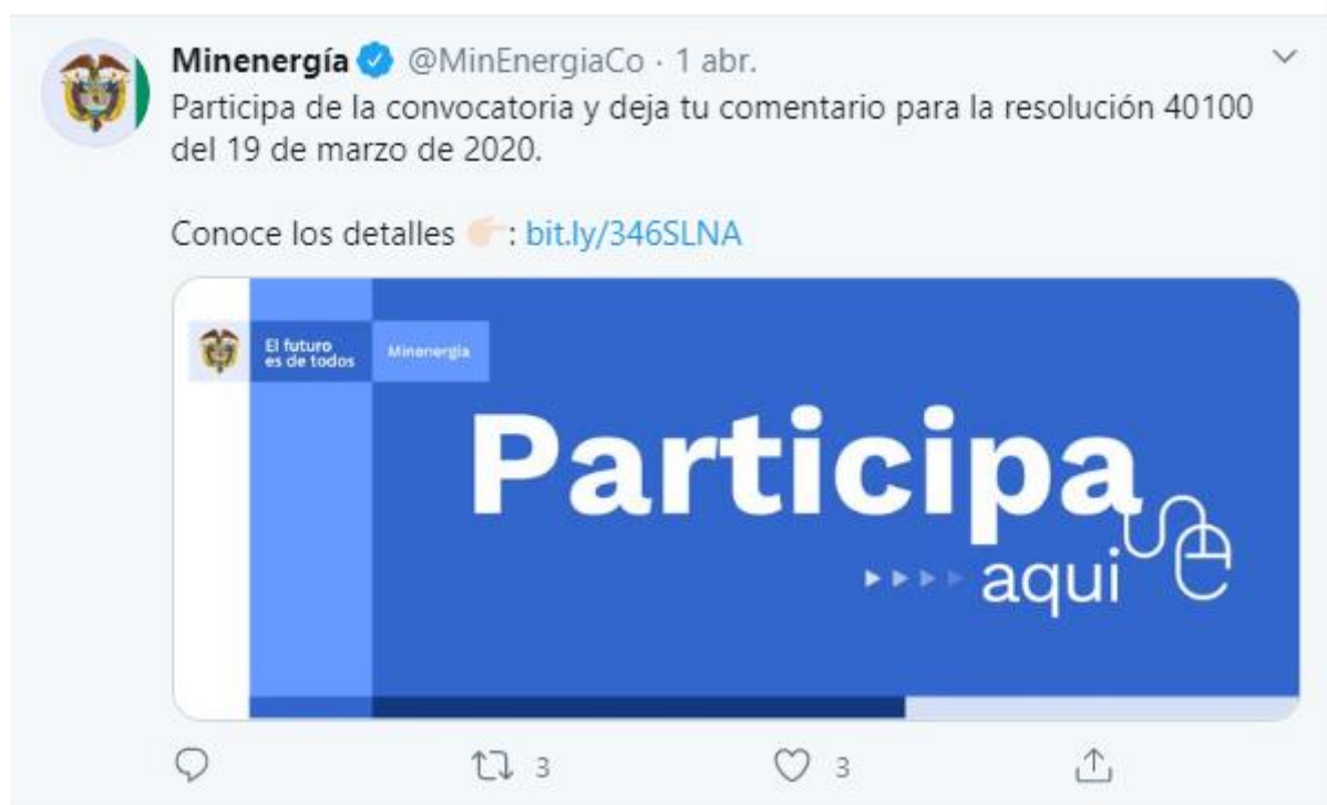
Ilustración 4 Divulgación: Redes Sociales