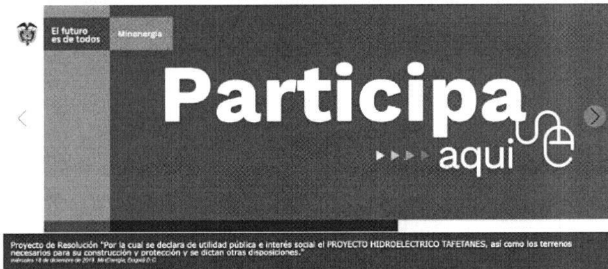
Ilustración 2

En Minenergía todos los trámites son gratuitos.