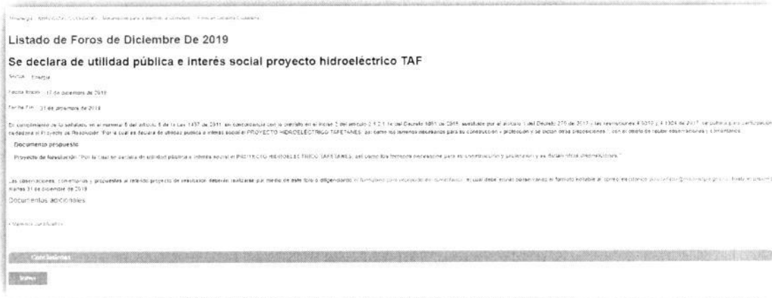
Ilustración 1 Divulgación: MinMinas/Atención al Ciudadano/Foros/