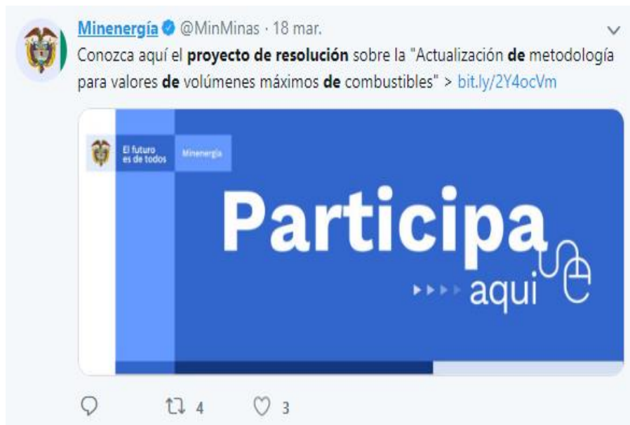
Divulgación 3: Redes sociales