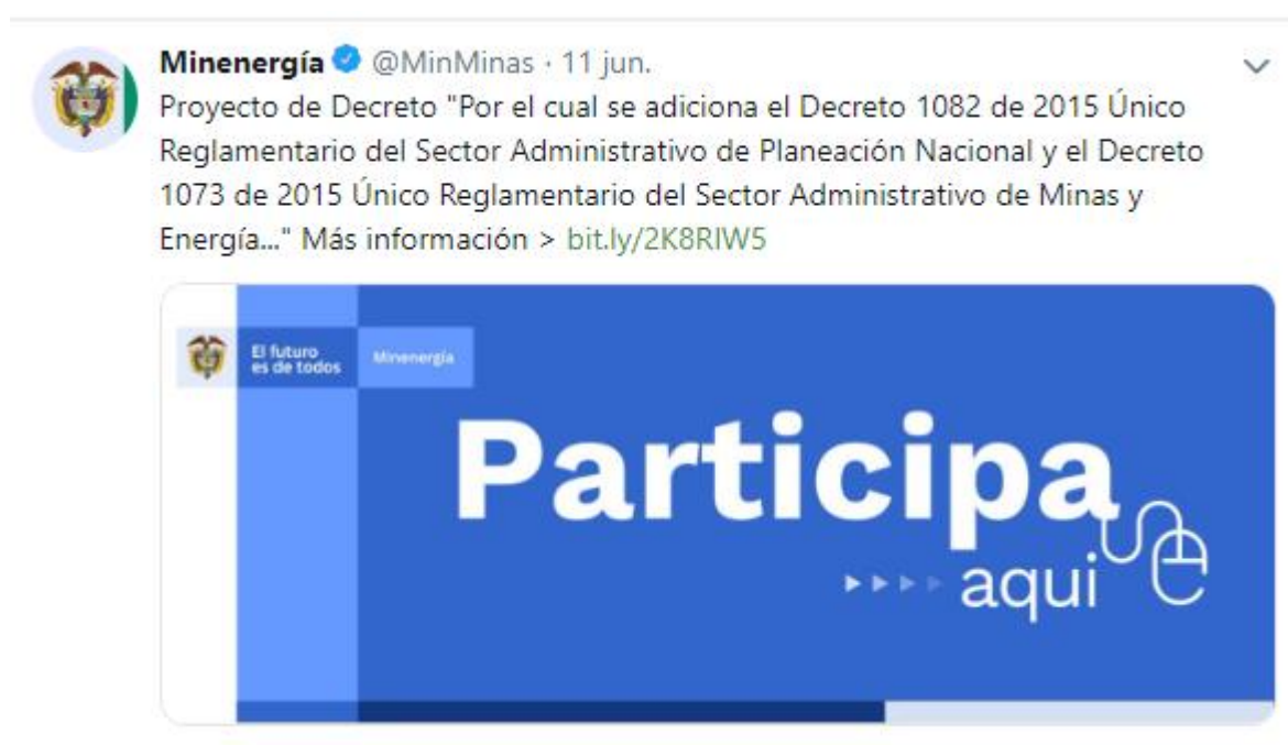
Ilustración 3