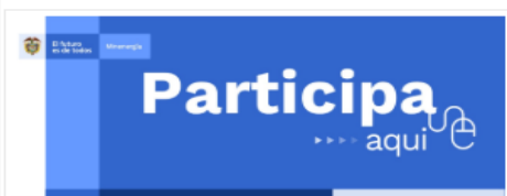
Ilustración 1 Divulgación: MinEnergía /Atención al Ciudadano/Foros/