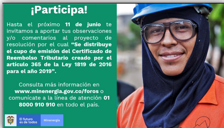
Ilustración 3 Divulgación: Mensaje correo electrónico