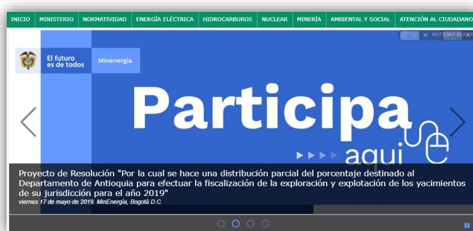
Ilustración 1 Divulgación: MinMinas/Atención al Ciudadano/Foros/