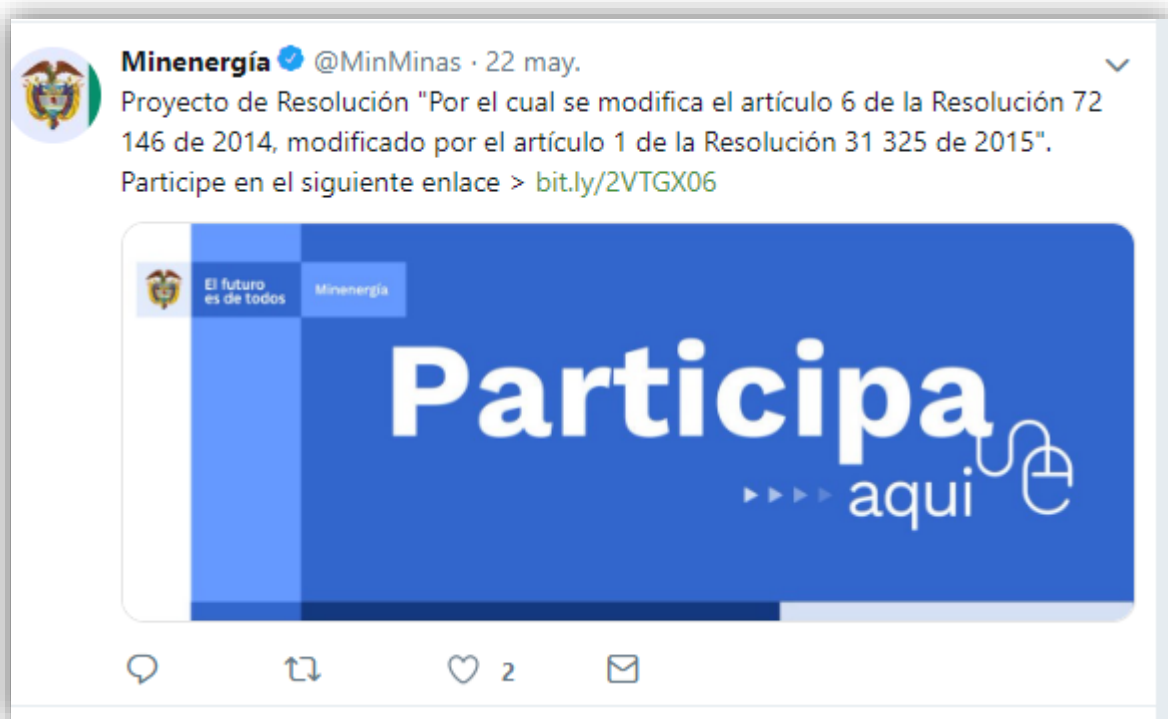
Ilustración 3