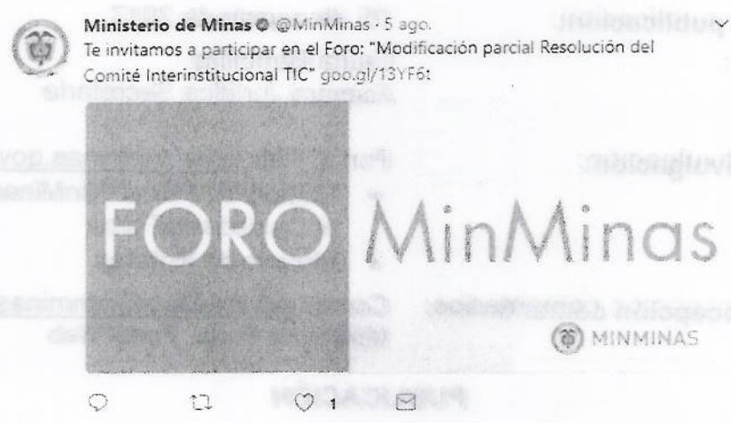
Ilustración 3 Divulgación en Redes sociales